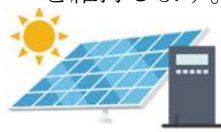
太陽光発電+蓄電池

専有部の支援：各戸別の太陽光パネルとポータブル蓄電池を活用し、停電時でもスマートフォンの充電や冷蔵庫、照明などの利用を可能にすることで、在宅避難時の暮らしの質を維持します。（一部物件のみ）