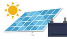
戸別太陽光発電+戸別蓄電池